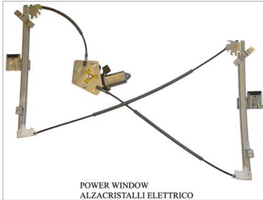
POWER WINDOW ALZACRISTALLI ELETTRICO

Alzacristalli elettrico per Lunotto Posteriore - Electric window regulator for rear window - Elevallas electrico para Luneta Trasera - Elektrische raamheffers achterraam